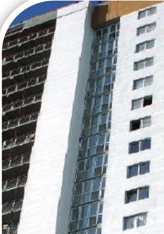
Управляющие компании, ТСЖ и ЖСК

Обеспечиваем единство и точность измерений для организаций и физических лиц